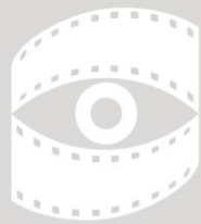
фото клуб ЕЛЕМА

Црно бела фотографија целосно тонирана во една боја останува монохроматска, и може да учествува во категорија на црно-бели фотографии, таквото дело може да биде репродуцирано како црно-бело во каталог под патронажа на ФИАП .Од друга страна, црно бела фотографија, модифицирана со парцијално, делумно тонирање или додавање на една боја, станува колор фотографија (полихром) и може да учествува во колор категорија, таквото дело бара колорна репродукција во каталог на салон под патронажа на ФИАП.